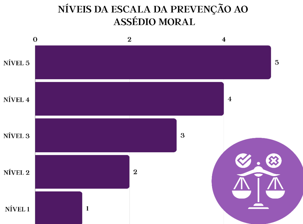
Gráfico 2 – O Ciclo Virtuoso da Prevenção ao Assédio Moral